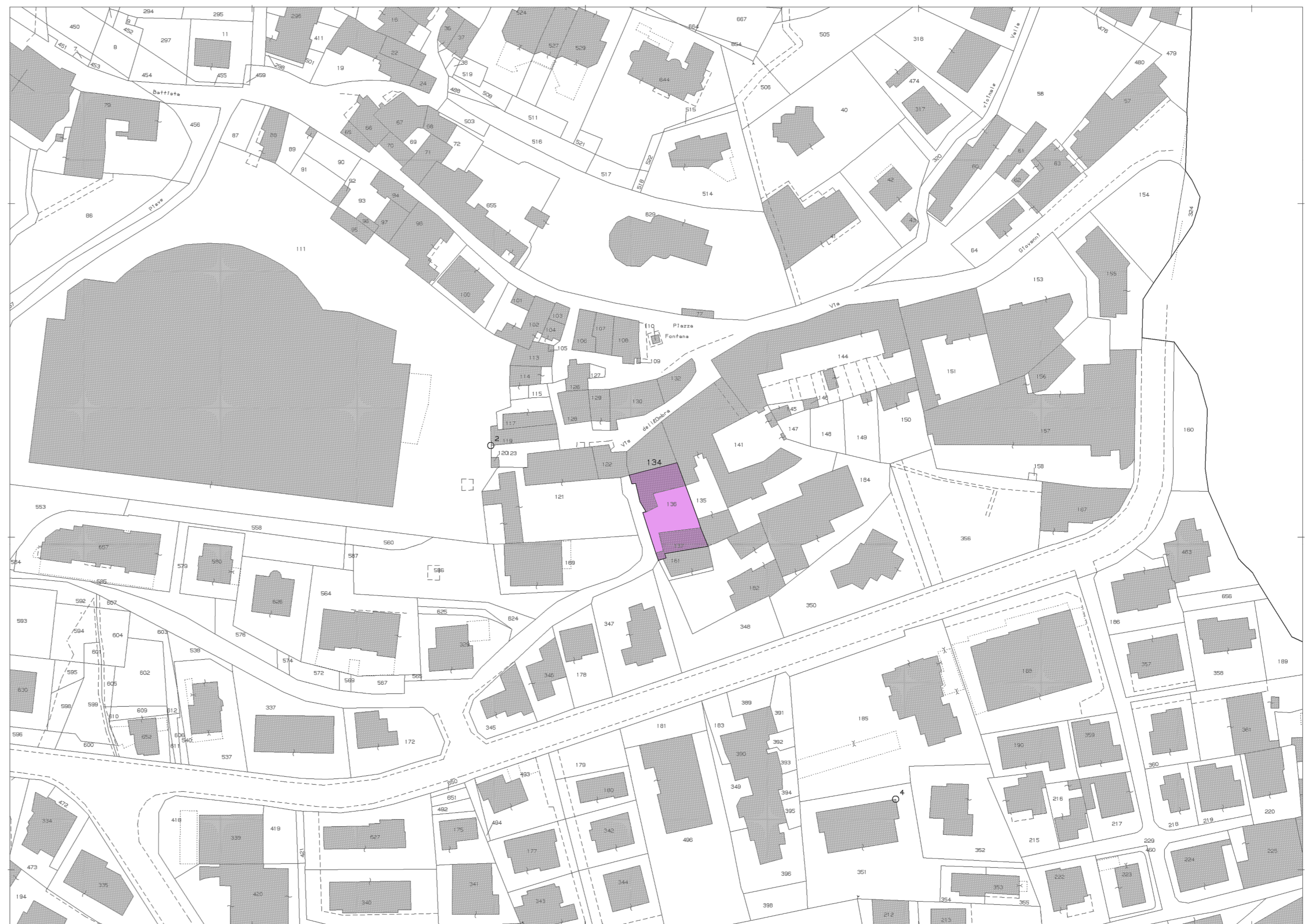
ESTRATTO MAPPA CATASTALE, FG. N°12, MAPP. 134parte,136,137,161parte 1:1000

PIANO DI RECUPERO VICOLO DELL'OMBRA n° 39