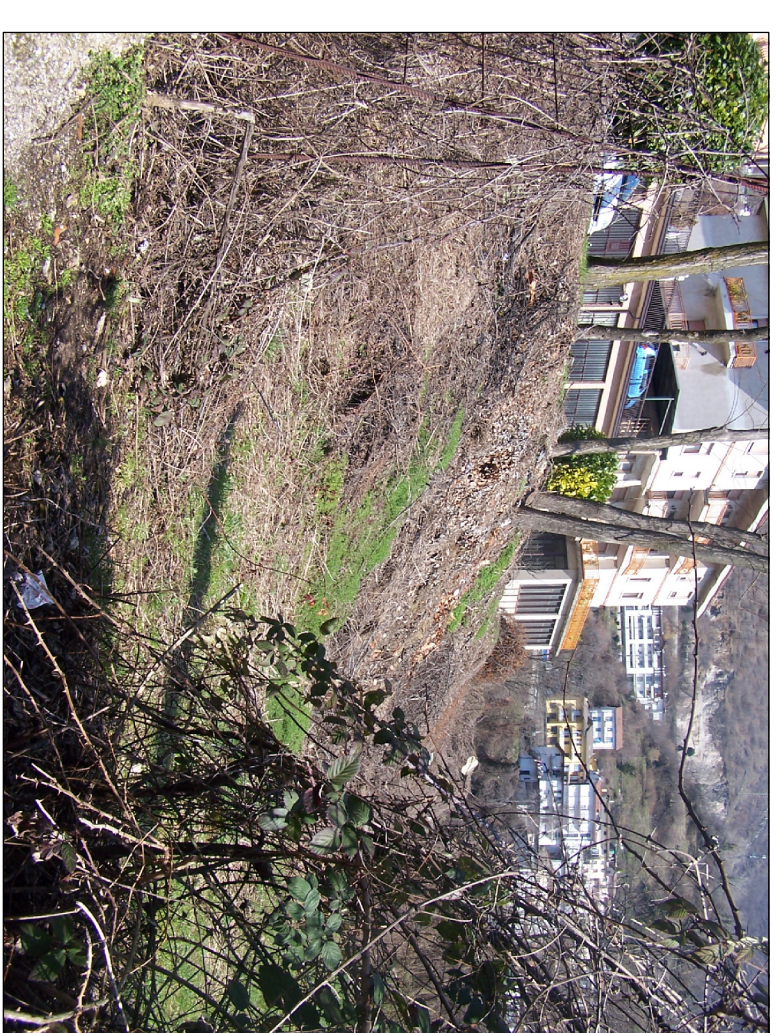
PUNTO DI RIPRESA N° 7