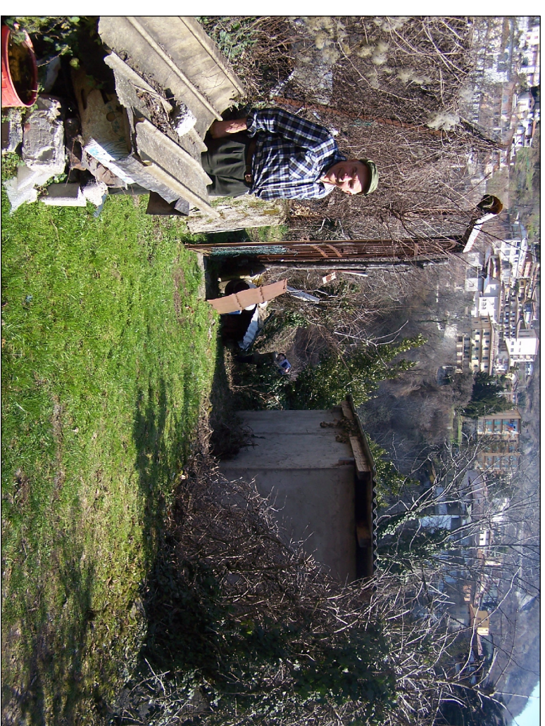
PUNTO DI RIPRESA N° 11