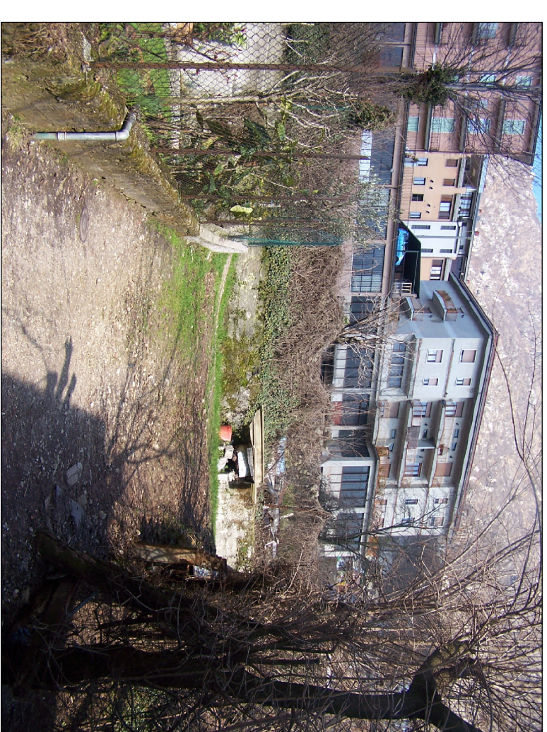
PUNTO DI RIPRESA N° 10