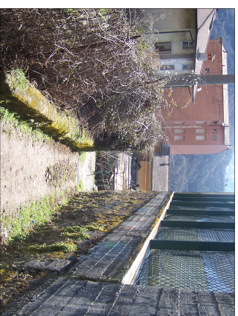
PUNTO DI RIPRESA N° 6