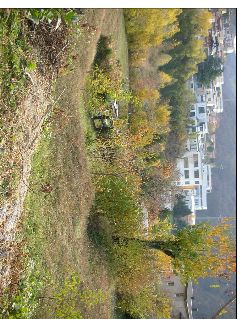
PUNTO DI RIPRESA N° 3