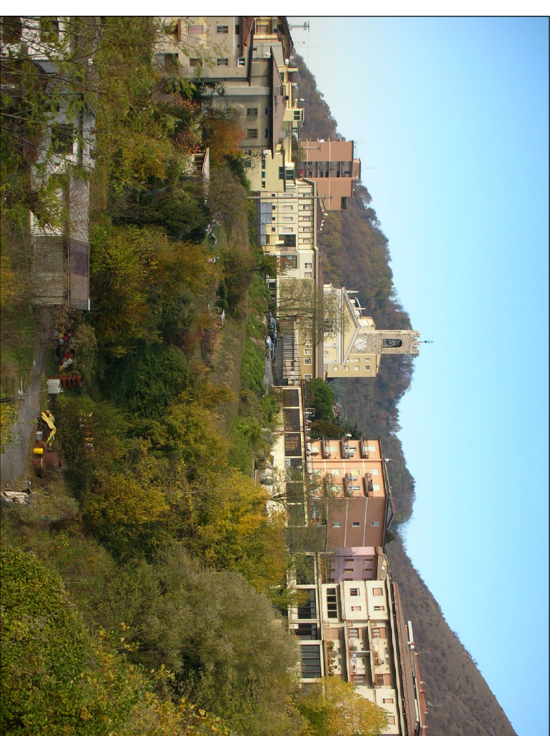
PUNTO DI RIPRESA N° 13