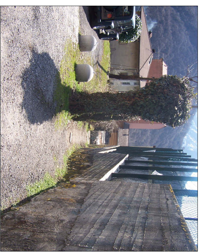
PUNTO DI RIPRESA N° 1