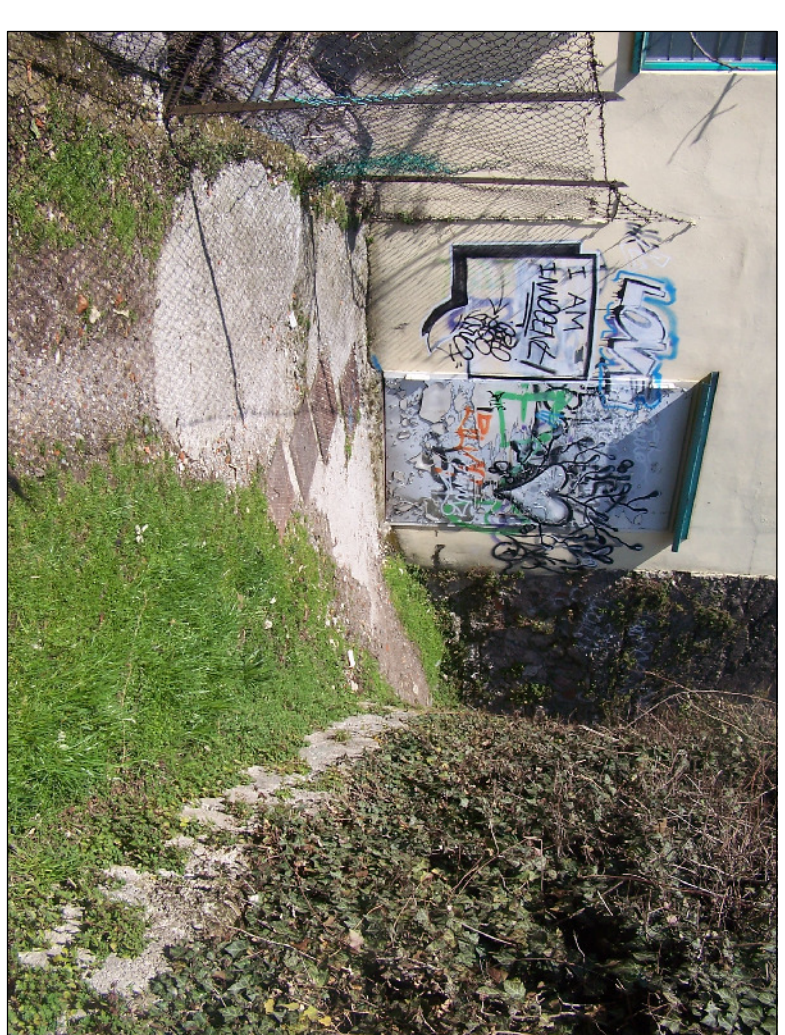
PUNTO DI RIPRESA N° 8