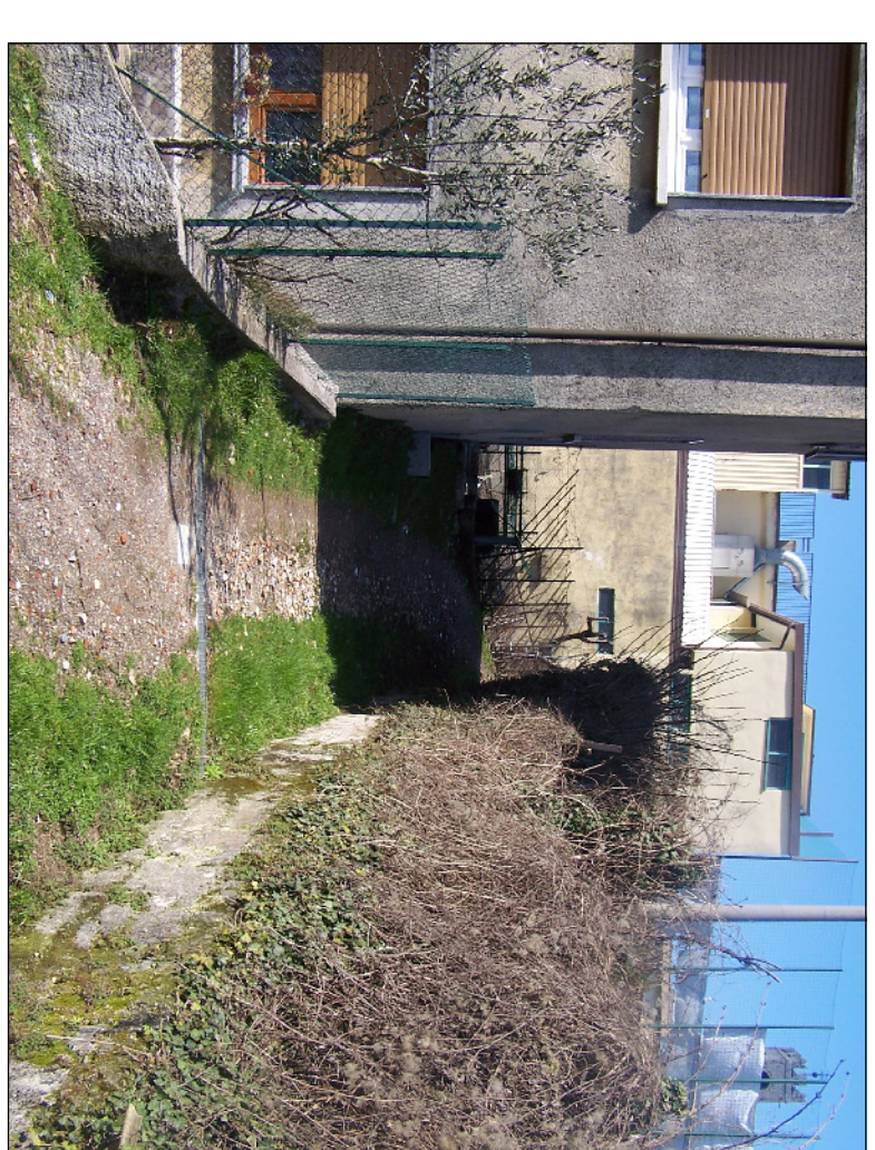
PUNTO DI RIPRESA N° 9