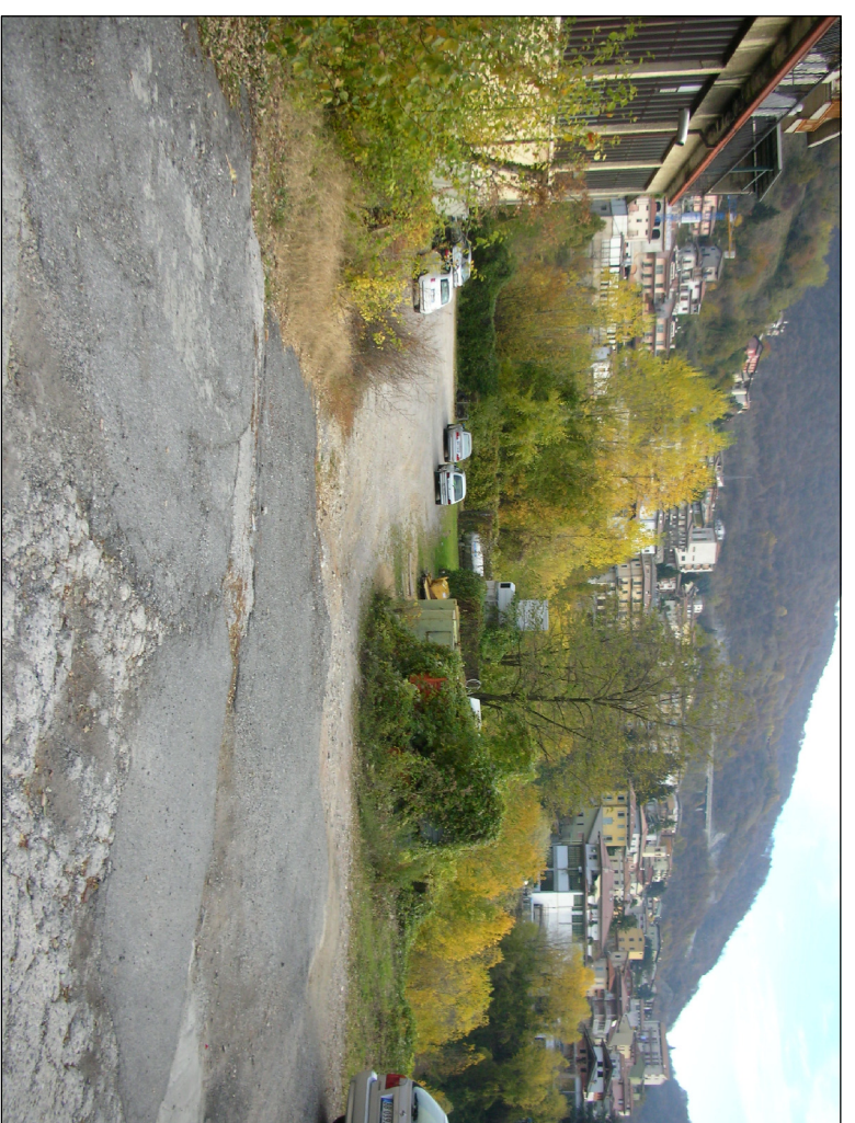
PUNTO DI RIPRESA N° 2