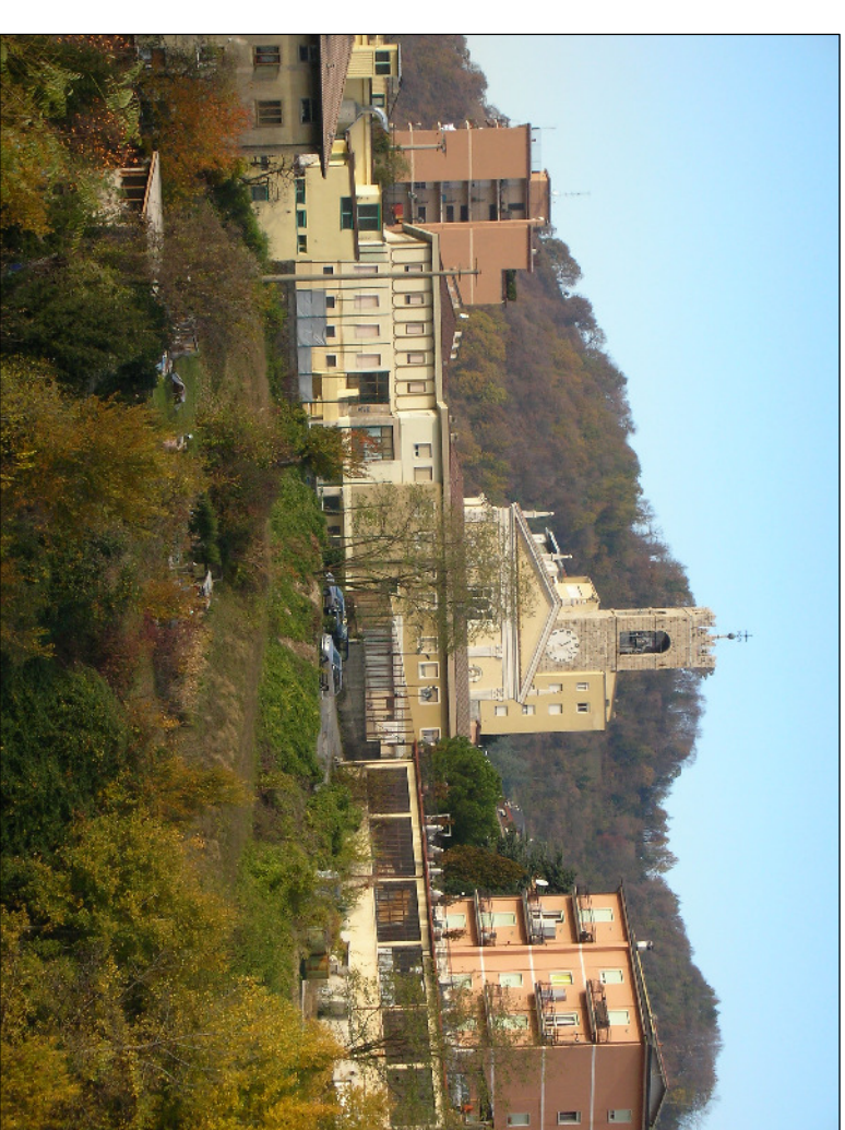
PUNTO DI RIPRESA N° 12