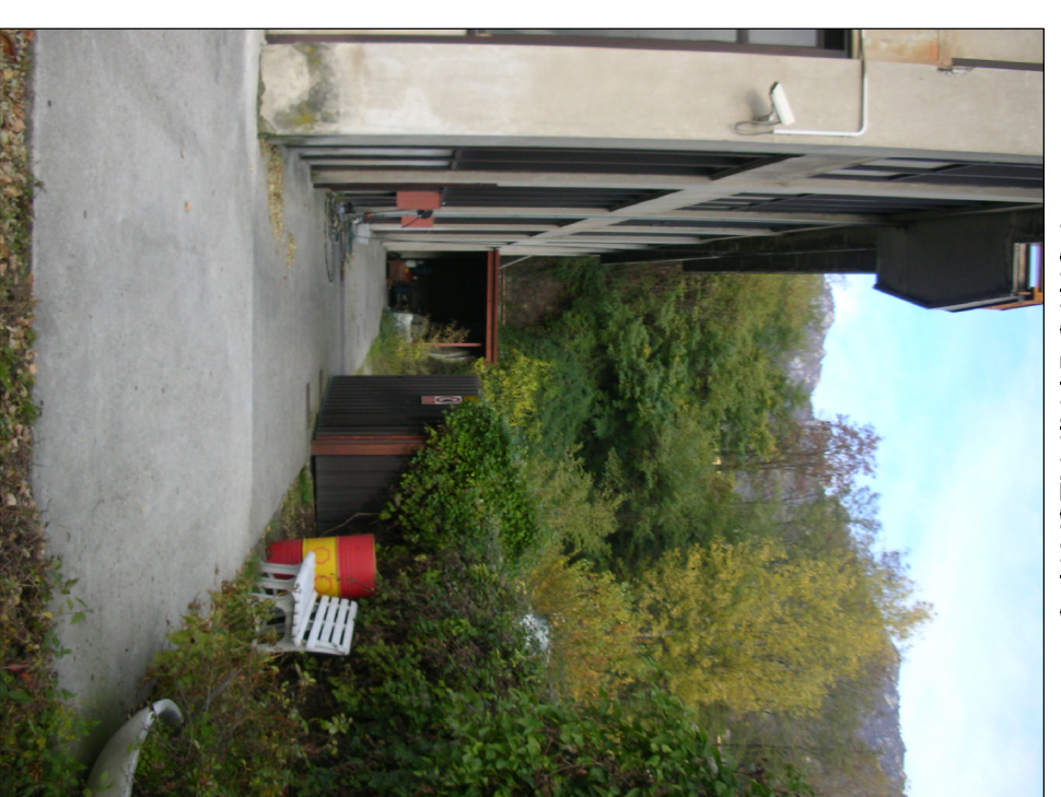
PUNTO DI RIPRESA N° 5