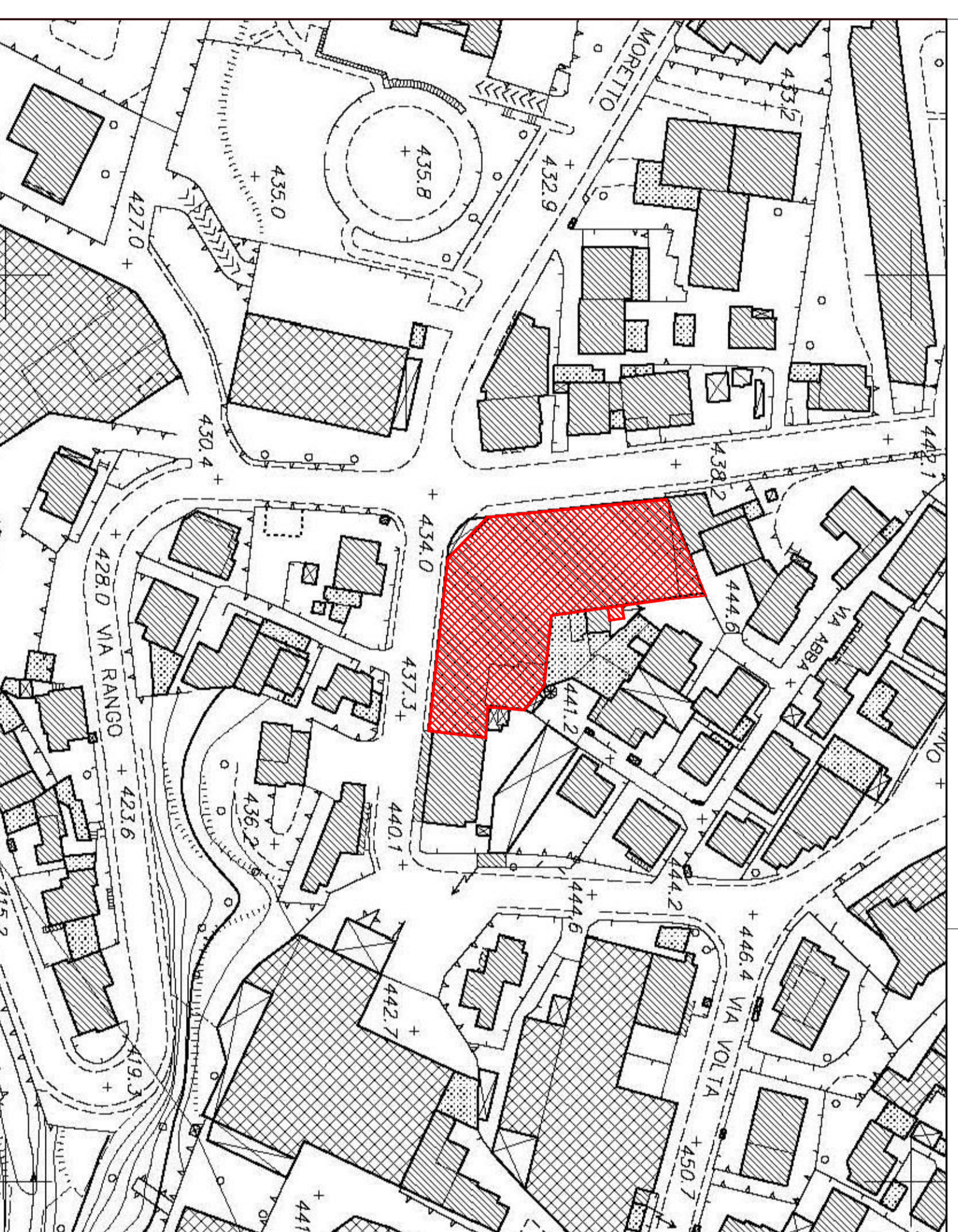
ESTRATTO AEREOFOTOGRAMMETRICO - 1:1.000